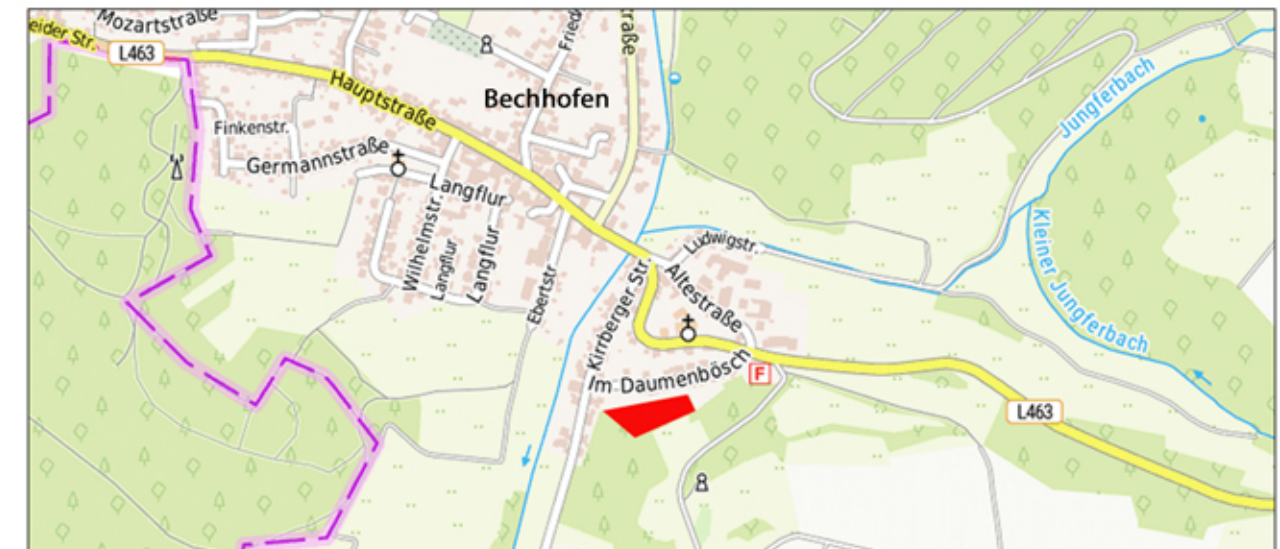
Lageübersicht (ohne Maßstab)

AU1/EE5 Jungwuchs bzw. gering bis mäßig verbuschte Grünlandbrache